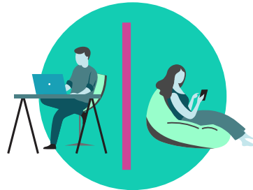
Trata de quedarte en un cuarto aparte