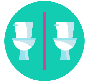
Usa un baño separado de las otras personas