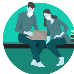
Usa una mascarilla facial si tienes que estar alrededor de otros