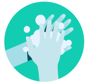
Lávate las manos con agua y jabón